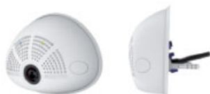
Mit 15° Objektivneigung