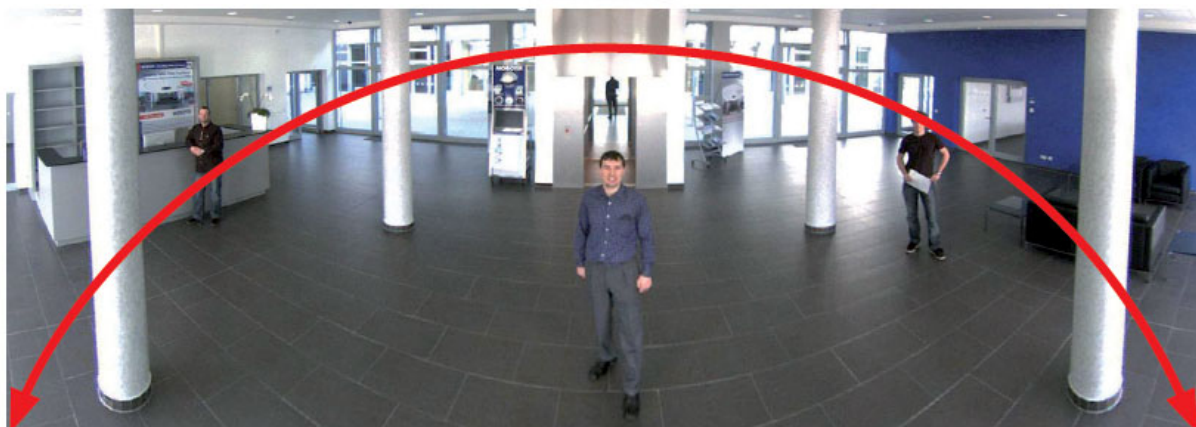
Lückenloser Erfassungsbereich: Die wandmontierte i25 bietet einen 180°-Panoramablick.